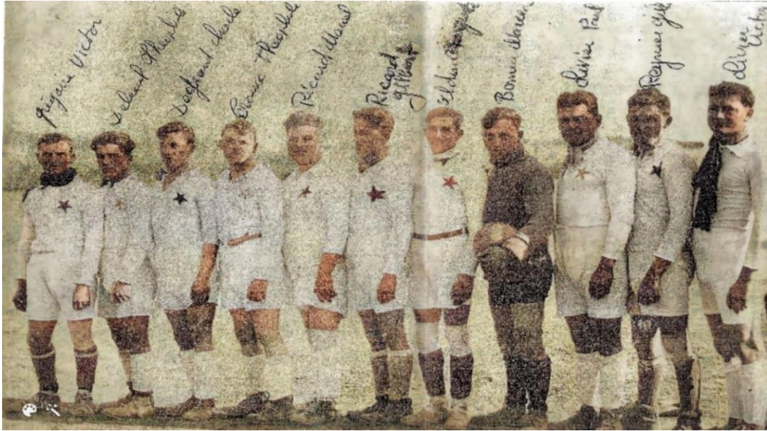
les joueurs de l'équipe de l'ESA Villelaure, 1926-1927.