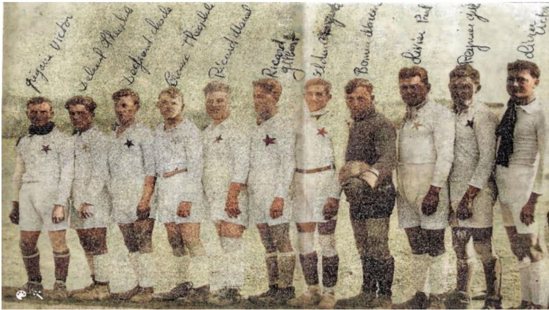
els jugadors de l'equip de l'ESA Villelaure, 1926-1927.