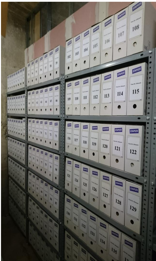
Detall d'una de les prestatgeries actuals de l'Arxiu.