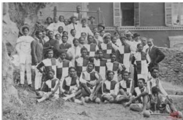
El equipo de rugby del Stade Olympique de l'Emyrne, el 1912.

Menos de diez años después del desembarco de las tropas francesas, los malgaches ya juegan a rugby. Este deporte creció notablemente (aparición de varios clubes, espectadores, prensa...); el primer club malgache, el SOI (Stade Olympique de l'Imerina), se fundó en 1909, a pesar de que en 1911 pasa a ser el SOE (Emyrne). Hasta 1957, el rugby era el deporte preferido por todo el mundo. Participa en el nacimiento de las luchas nacionalistas. El pueblo malgache ve en su práctica —o en su espectáculo— un espacio y un medio que permite la expresión de su cuerpo y de sus sentimientos, tanto para los jugadores como para los espectadores, entrenadores y periodistas.