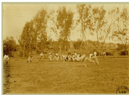
Primeros equipos de rugby malgache (campamento del teniente Antoni en Betongolo, Antananarivo), hacia 1900.

Menos de diez años después del desembarco de las tropas francesas, los malgaches ya juegan a rugby. Este deporte creció notablemente (aparición de varios clubes, espectadores, prensa...); el primer club malgache, el SOI (Stade Olympique de l'Imerina), se fundó en 1909, a pesar de que en 1911 pasa a ser el SOE (Emyrne). Hasta 1957, el rugby era el deporte preferido por todo el mundo. Participa en el nacimiento de las luchas nacionalistas. El pueblo malgache ve en su práctica —o en su espectáculo— un espacio y un medio que permite la expresión de su cuerpo y de sus sentimientos, tanto para los jugadores como para los espectadores, entrenadores y periodistas.