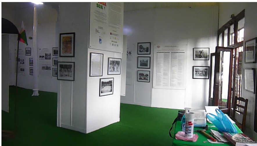
Vista d'una part de la zona 0 de l'exposició, setembre del 2021, Antananarivo.

L'objectiu d'aquesta exposició és explicar el més fidelment possible el rugbi malgaix des dels seus orígens fins als Makis, valorar la seva llarga història plena d'exploacions i drames... L'exposició permet descobrir documents, obres o objectes variats i sorprenents. La tria dels documents s'ha articulada al voltant de tres eixos: l'interès històric, científic o artístic, la raresa o la característica inèdita dels documents exposats, la diversitat de les fonts: arxius internacionals i públics (Arxius i Biblioteca Nacionals de Madagascar, Agència ANTA, Arxius Nacionals d'Ultramar d'Ais de Provença, Biblioteca Nacional de França, INA...), obres de fotògrafs (Dany Be, Pierrot Men, Nantenaina Rakotondranivo, Franck Sanse...) i dissenyadors (Doda, Mek, Pov, Claude Serre, Michel Iturria). L'exposició està formada per un conjunt d'objectes i documents molt diferents: fotografies i vinyetes de premsa, obres d'art o arxius, documents sonors i audiovisuals (pel·lícules), cartells, entrades de partits, llibres, diaris, cartes, pilotes, samarretes, trofeus (copes, medalles), banderes i banderins... Al llarg del recorregut, es presenten al públic llocs (estadis), clubs i persones (jugadors, entrenadors, àrbitre i directiu), per entendre millor l'esperit del rugbi malgaix o malagasy .