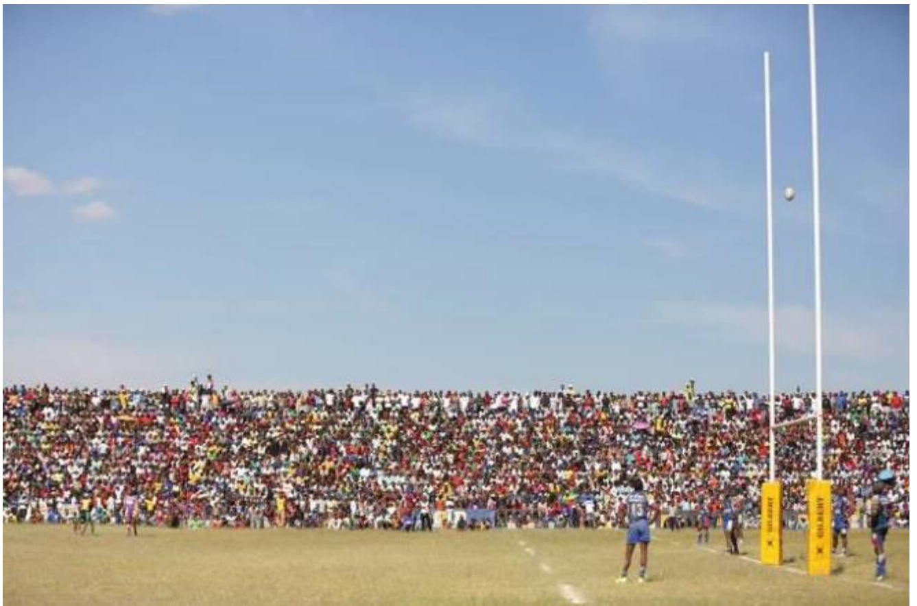
Penal, moment de tensió, públic i jugadors miren la pilota entre els pals, en un partit entre l'FTM i l'USA a l'estadi Makis, Antananarivo, 2016.