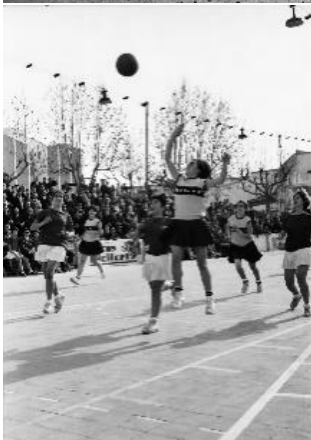
Algunas de las imágenes deportivas de la exposición-taller.