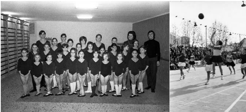
Algunes de les imatges esportives de l'exposició-taller.