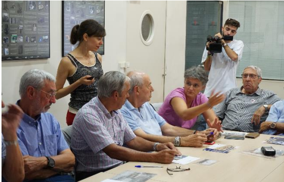
Participants en el taller fet al CRDI.

La valoració global de l'experiència és molt positiva, en el sentit que es van aconseguir aconseguir els objectius principals del projecte, és a dir, vincular les persones amb el patrimoni cultural — en aquest cas, la fotografia— i fer-los participants de la tasca de posar en valor aquest patrimoni digitalitzat, que en l'àmbit europeu circula principalment al voltant de la plataforma Europea. Es tractava, doncs, d'una iniciativa de clar abast europeu que pretenia precisament posar el focus en l'usuari i, a partir de la seva implicació, despertar i fer créixer l'interès per la cultura, i també fer-ho a partir d'un ús innovador de la tecnologia, encara que relegant-la al lloc que li és propi, és a dir, l'espai funcional, posant la tecnologia al servei de les persones i del patrimoni.