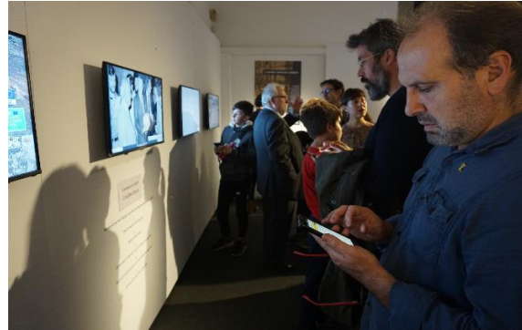
Visitants a l'exposició el dia de la inauguració.